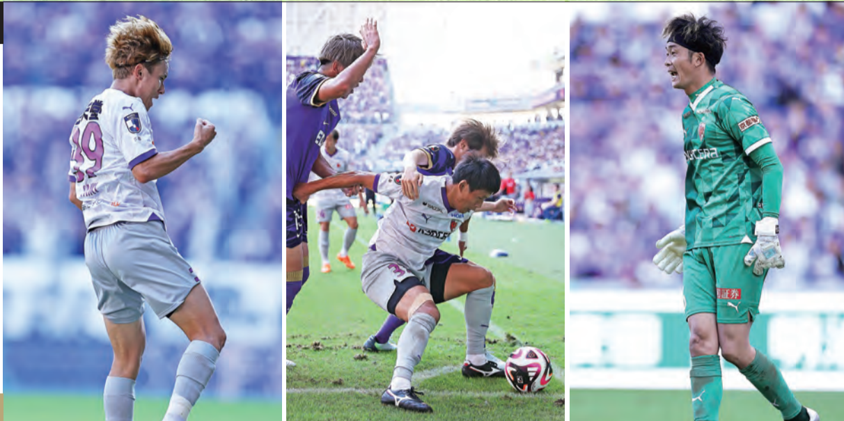
第35節 エディオンピースウイング広島 AWAY

その後は広島の猛攻を粘りの守備で跳ね返し、首位に立っていた相手から見事、勝点3を奪い取りました。