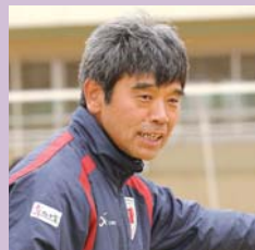
ホームタウンアカデミー ダイレクター

最近、「クラブ育成組織のセレクションをお受験感覚で受ける人が増えています。関西4クラブのセレクションを全部受けて、受かったところに行こう、受かった中から選ぼうとしている人も多いようです。しかし、いくら「クラブの育成組織に入れたから」といって、エスカレーター式にプロに上がれるわけではありません。私としては「本当はどのクラブに行きたいの?」、「プロになれるのなら、どのクラブでもいいの?」、「自分が生まれ育った町のクラブに行く方が、応援してくれる人も多いよ」、「セレクションに一度落ちて、また次のチャンスまでしっかり準備しよう」、「高校に進学してサッカーを続けて、プロにチャレンジすることはできるよ」など、子どもに寄り添っているようなヒントを示してあげながら、子どもが自分で人生の選択をしていけるよう、手助けしてあげてほしいと思っています。