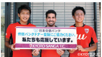
京都サンガF.C.は、骨髄バンクの普及とドナー登録者の増加に協力しています。

白血病、再生不良性貧血などの病気は、骨髄移植や末梢血幹細胞移植で治るようになりました。この治療法には、ドナー(提供者)が必要です。