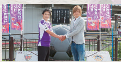
JR亀岡駅前のサッカーボールモニュメント前にて

わいづくりに期待が高まっています。京都府初 の球技専用スタジアムなので、必ずまちの空気 感が変わるでしょうし、サッカー熱が上がり、子 どもに夢や希望を持ってもらえると感じています。 スタジアムが完成した時には、サンガもさらに上 のカテゴリーで躍進していただきたいですね。