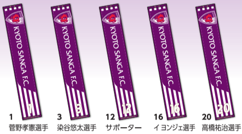
1 菅野孝憲選手 3 染谷悠太選手 12 サポーター 16 イヨンジエ選手 20 高橋祐治選手