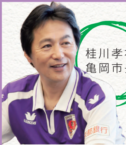
桂川孝裕 亀岡市長

2014年にホームタウンとなって以来、サンガと手を取り合いながら 勢いと活気を増しつつある亀岡市。今回は染谷悠太選手が桂川孝裕市長のもとを訪ね、 気になる新スタジアムやリーダーシップについて語り合いました。