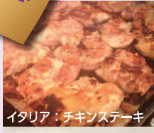
イタリア：チキンステーキ