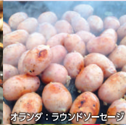
オランダ：ラウンドソーセージ